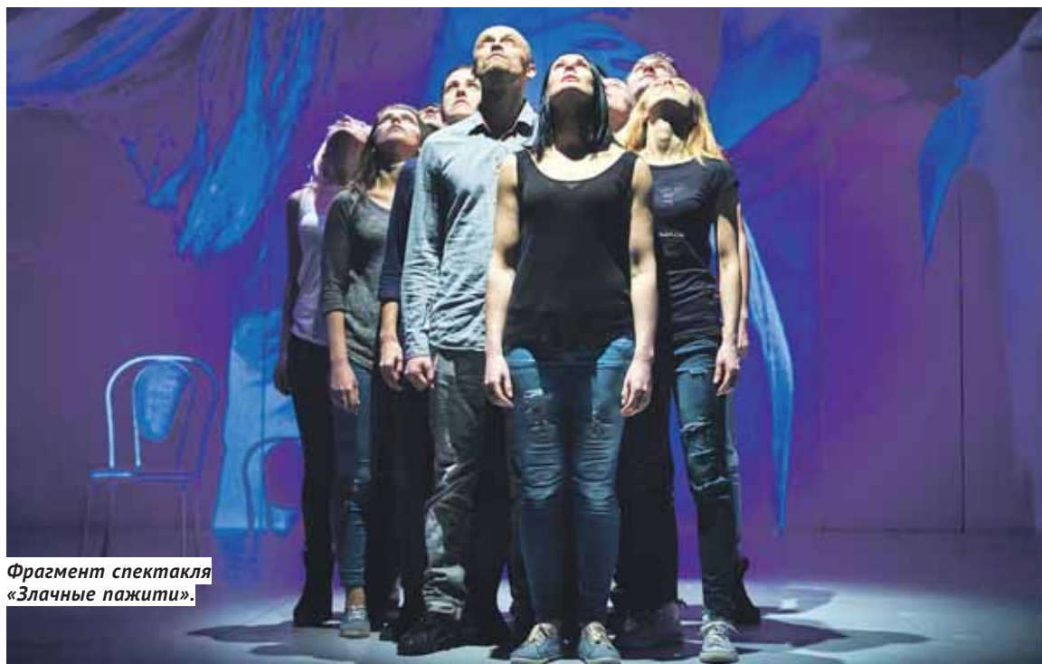
Фрагмент спектакля «Злачные пажити».

Какие премьеры готовят новосибирские театры под занавес 2017 года?