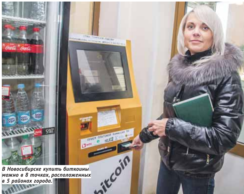
В Новосибирске купить биткоины можно в 8 точках, расположенных в 5 районах города.

Закон о Центральном банке РФ, на который его глава Эльвира Набиуллина ссылается, аргументируя свою позицию об отказе использовать криптовалюты в качестве платёжного средства, гласит, что национальной валютой в