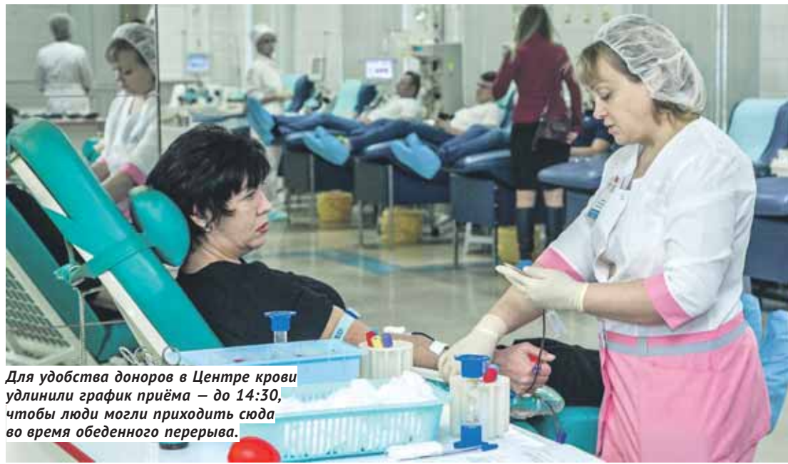
Для удобства доноров в Центре крови удлиннили график приёма — до 14:30, чтобы люди могли приходить сюда во время обеденного перерыва.

И ещё одно новшество Центра крови следует отметить: они удлиннили — до 14:30 — график приёма посетителей. Это сделано для того, чтобы люди могли сдать кровь во время своего обеденного перерыва. По словам Константина Хальзова, число доноров, которые воспользовались такой возможностью, постоянно возрастает.