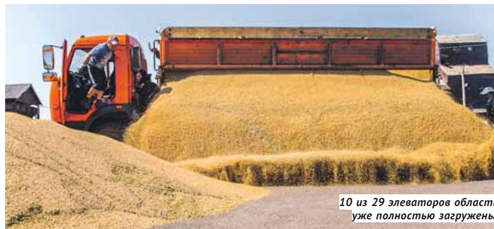
10 из 29 элеваторов области уже полностью загружены.

— Если суммировать все прогнозы от районов по провизорской урожайности, которые подаются к 1 августа, то валовый сбор зерна должен был составить чуть более 2,6 миллиона тонн, а по факту мы превысим 3 миллиона, — отметил министр сельского хозяйства НСО Василий Пронькин. — Только Кочковский и Болотнинский районы дали точные прогнозы, а у остальных они были существенно занижены, порой до 30 процентов. Может, это попытка перестраховаться, но по факту мы сами себя поставили в сложную ситуацию. И такая же картина