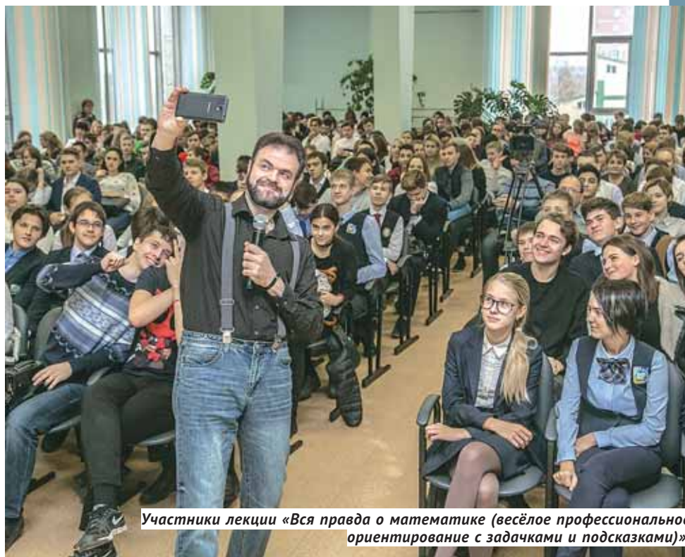
Участники лекции « Вся правда о математике (весёлое профессиональное ориентирование с задачами и подсказками) ».

Главная цель фестиваля, организованного правительством Новосибирской области, — популяризация науки и научных достижений, а также профориентационная работа со школьниками и студентами. Для гостей фестиваля организованы выставки, открытые лекции, круглые столы, квесты, интеллектуальные игры. Центральная часть программы проходит в ГПНТБ СО РАН. Тематика лекций разнообразна: генеалогическая классификация языков, каталитические технологии, основы современной криптографии, язык и культура тувинцев,