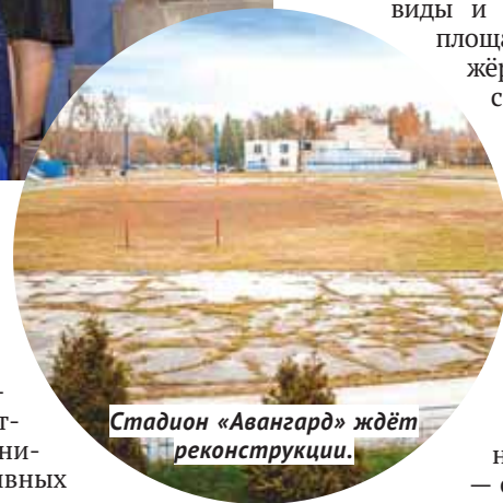
Стадион «Авангард» ждёт реконструкции.

У Бердска действительно есть все шансы стать центром спортивной жизни области. В 2017 году город провёл 36 региональных и 19 всероссийских соревнований. Только во Всероссийских сельских спортивных играх участвовали более 1 500 спортсменов. Восемь спортивных объектов Бердска прошли сертификацию и могут быть использованы для проведения соревнований различных уровней.